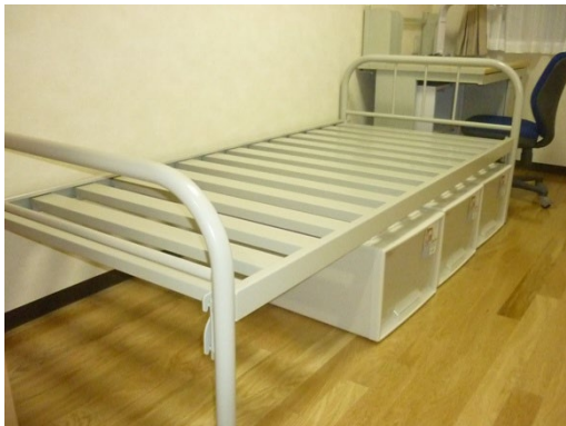
③シングルベッド (ベッド下35cm) (一人部屋用)