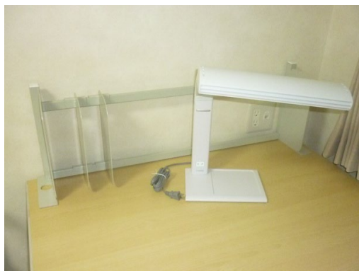
⑨電気スタンド ⑩本立て