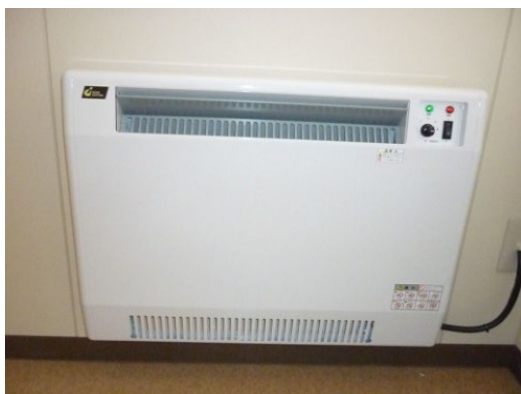
21. トイレ用電気パネルヒーター