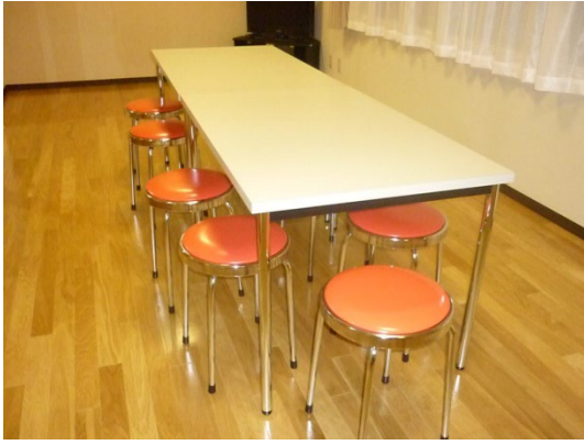
3. テーブル 4. 椅子