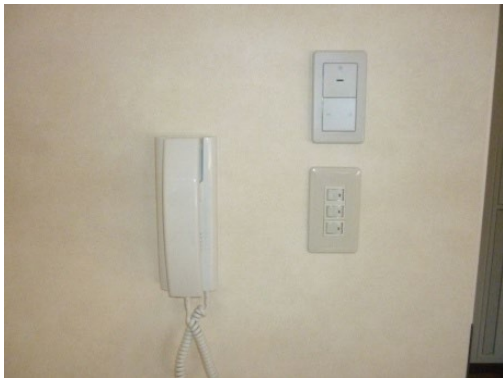
居室インターホン及び照明スイッチ