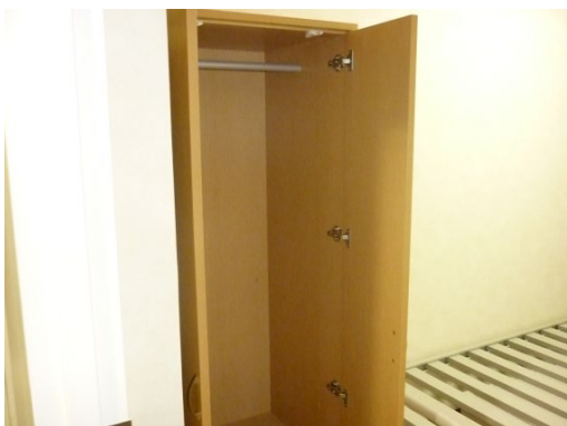
⑤ワードローブ (一人部屋用)