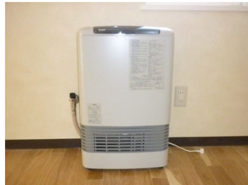
居室暖房器具（ガストーブ）