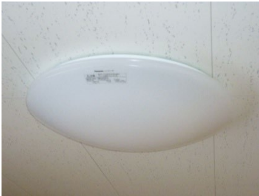
14. オープンリビング照明器具