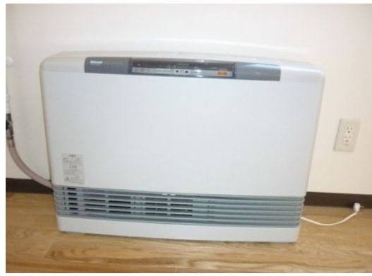
13. オープンリビング暖房器具