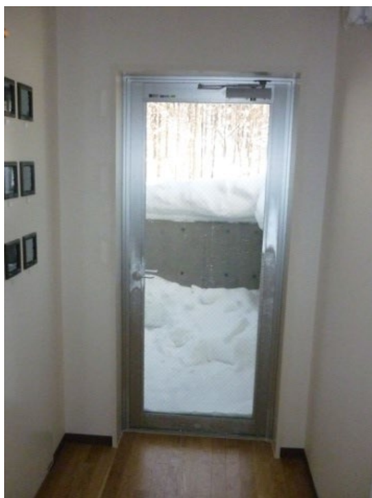
Aユニット側 非常口(1~5階)