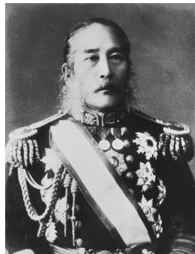
榎本武揚肖像