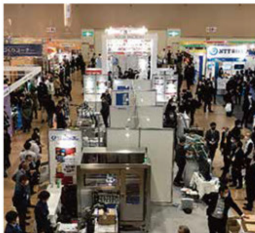
主催:北海道 運営:(公財)北海道科学技術総合振興センター(ノーステック財団)

※令和5年度ものづくり産業におけるグリーン・デジタル推進事業(電源立地地域対策交付金)