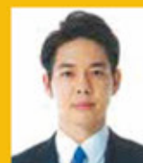
名誉会長 鈴木直道 (北海道知事)