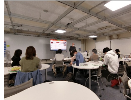
※実施イメージ：検討会