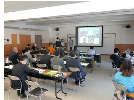
※実施イメージ：報告会