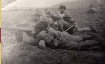
昭和18年ごろの軍事教練