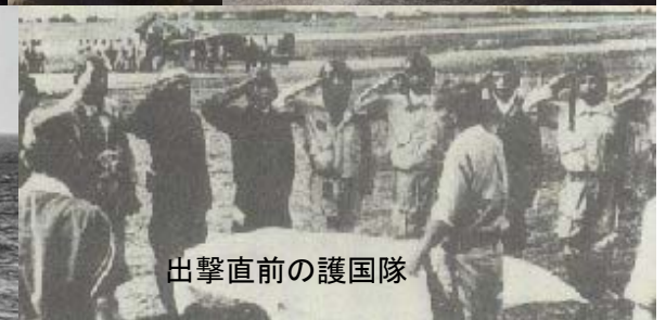
出撃直前の護国隊