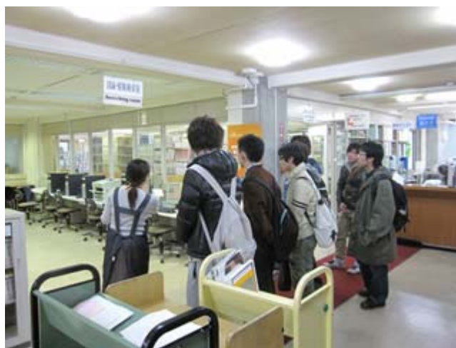
(ライブラリーツアー)