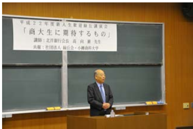
(高向会長による講演)