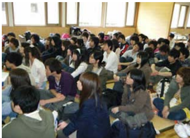
(プレゼン発表を真剣な表情で見守る新入生)