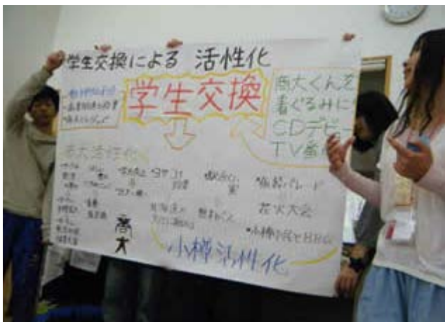
(プレゼン発表の様子)