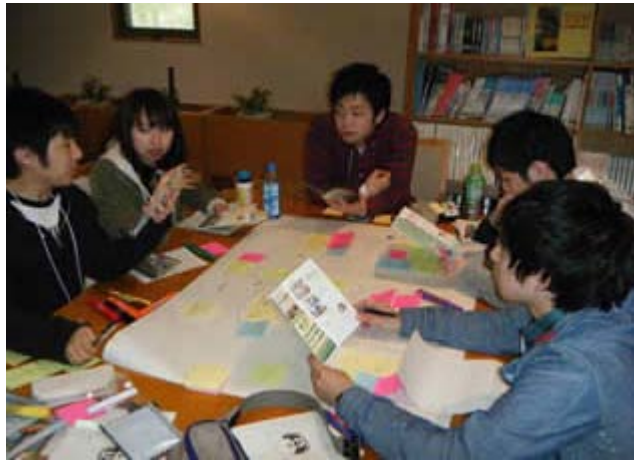
(本学新入職員のグループワークの様子)