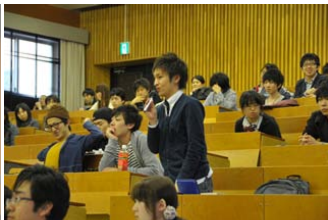
(高向会長に質問する新入生)