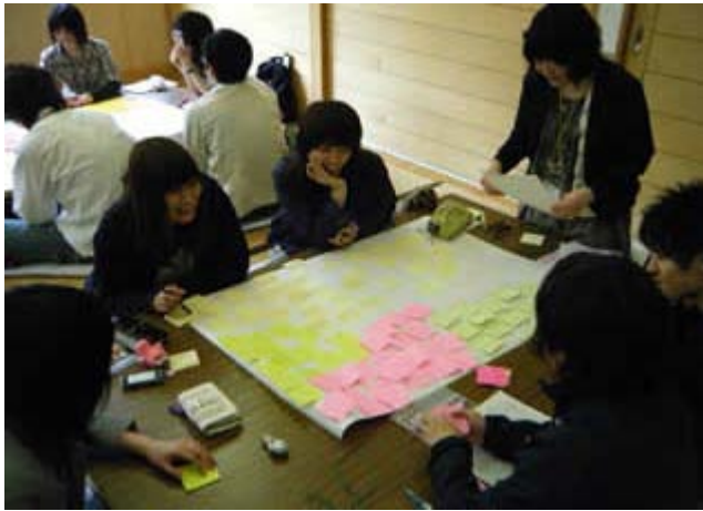
(新入生のグループワークの様子)