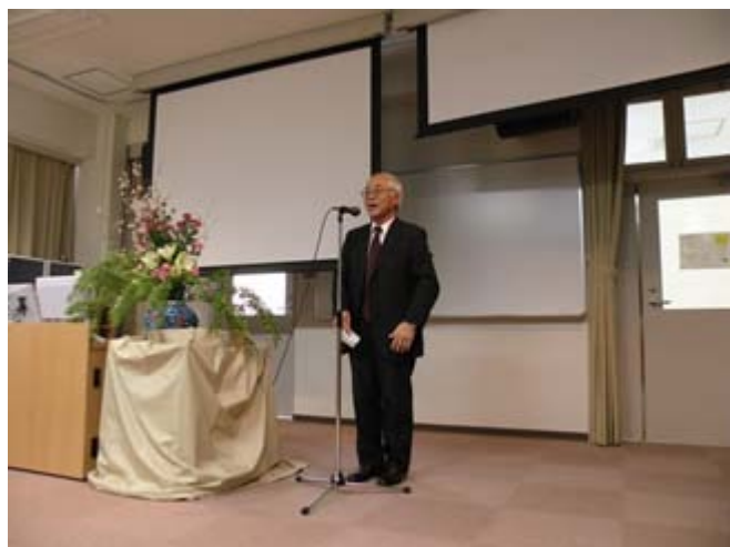
(システムの説明をする君羅仕様策定委員)