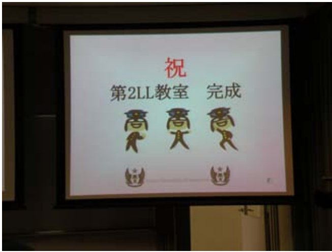
(完成を祝う商大君)