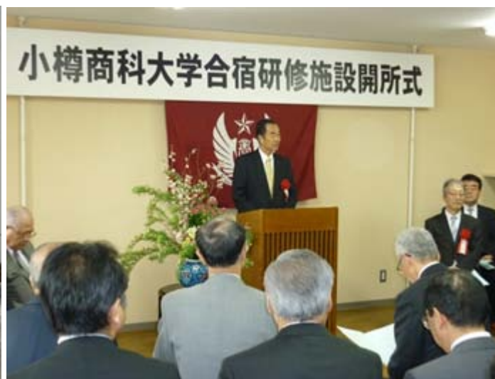
(齊藤緑丘会理事長からの挨拶)