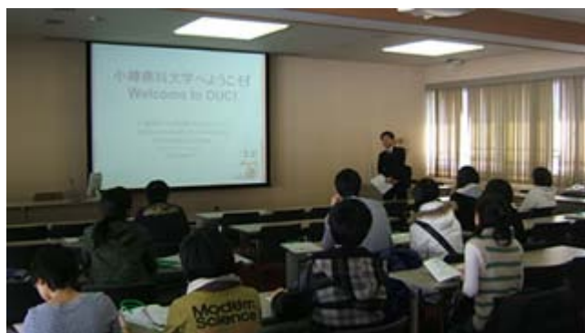
(オリエンテーションの様子)