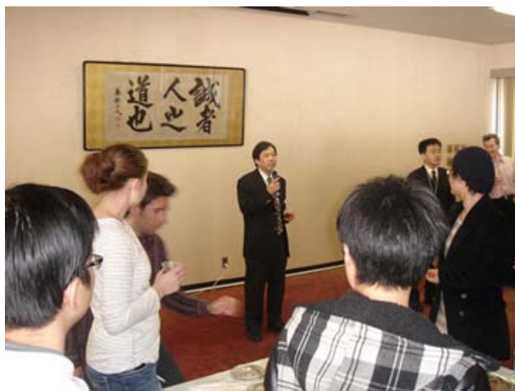
(穴沢国際交流センター長の挨拶)