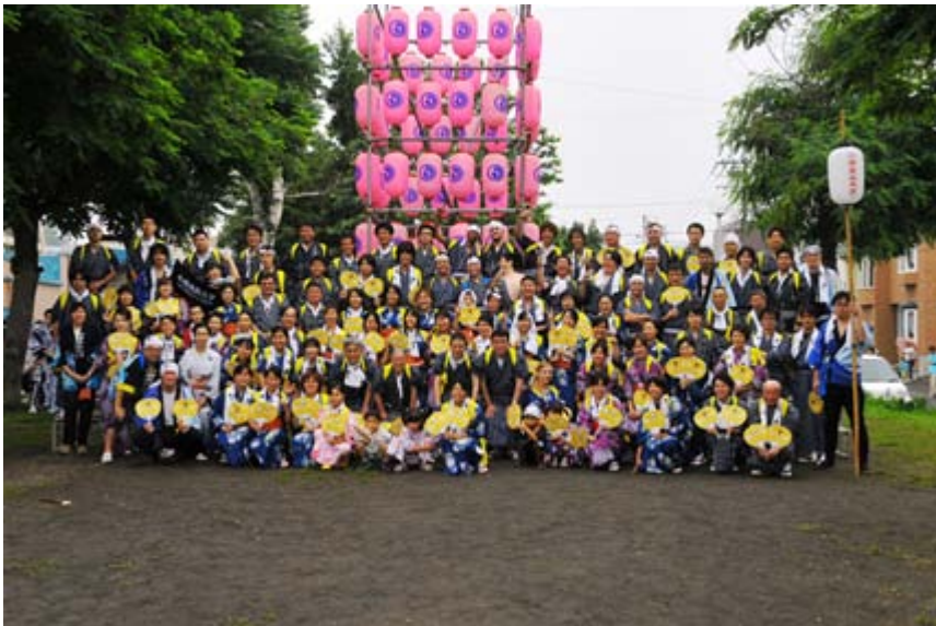
(本学梯団集合写真)