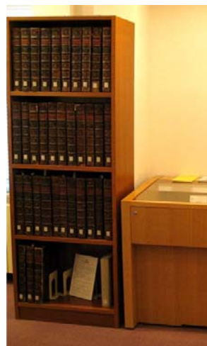
ディドロ, ダランベール編 『百科全書』初版 全35巻