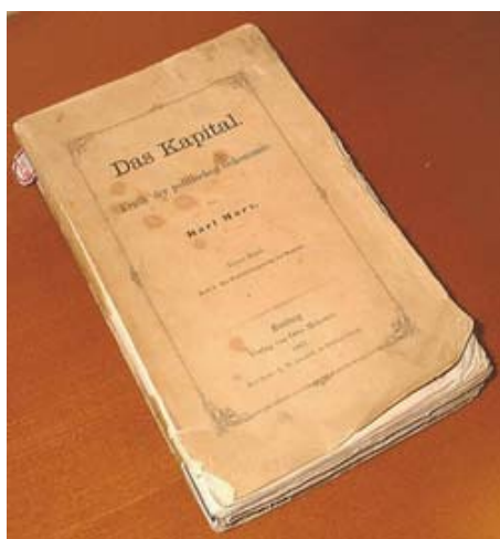
カール・マルクス著『資本論』第1巻 ドイツ語版 初版 献辞付 (大野文庫)