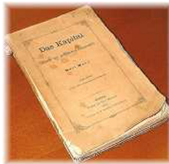
Karl Marx, Das Kapital, Bd. 1. Hamburg, 1867

《资本论》第一卷 德语 第一版 O 4.2||2502||83779 (大野文库)