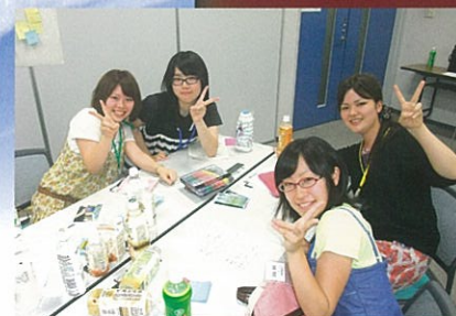
高校生のための夏期連続講義