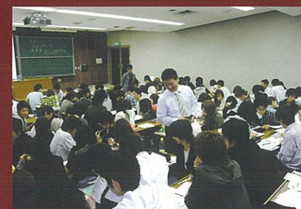
「社会科学と職業」のグループワーク