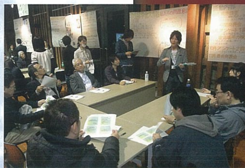
「地域連携キャリア開発(本気プロ)」の成果報告会