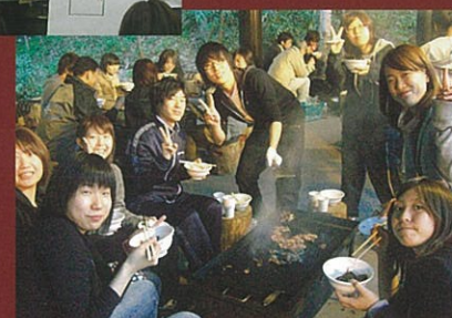
ルーキーズ・キャンプ