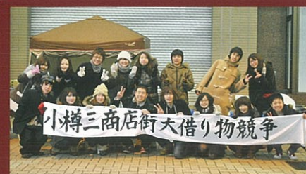
商大生による中心商店街活性化イベント